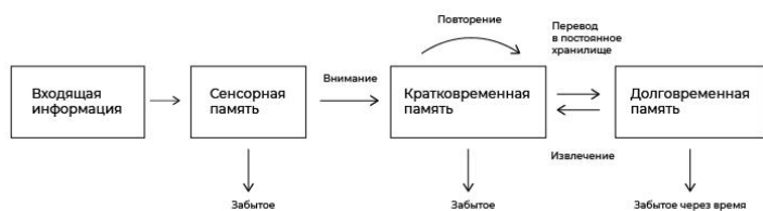
Модель памяти Аткинсона-Шиффрина

Он примерно на 75% состоит из воды, и каждый день потребляет больше всего энергии в организме на свою работу. Если воды или полезных элементов ему станет не хватать, то человек это ощутит.